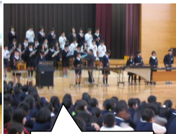
「八木節」を演奏する 6 年生